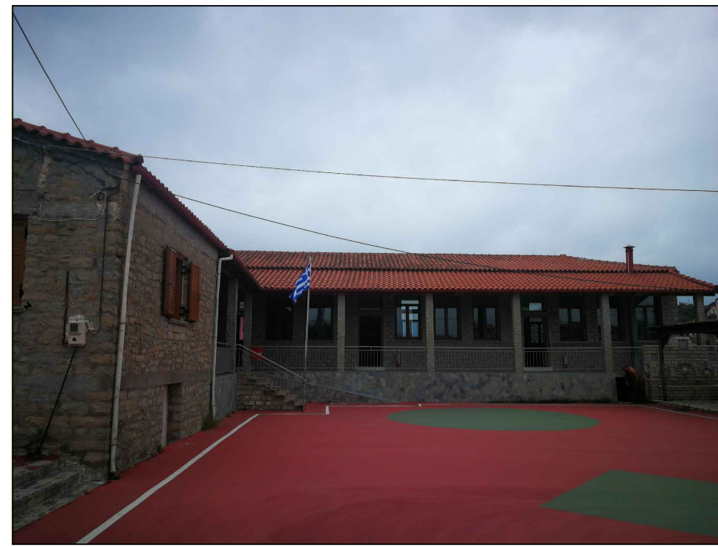
Φωτογραφία Από Θέση Λήψεως 1